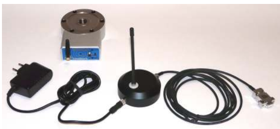
Right picture : connections during the WIMOD battery recharge